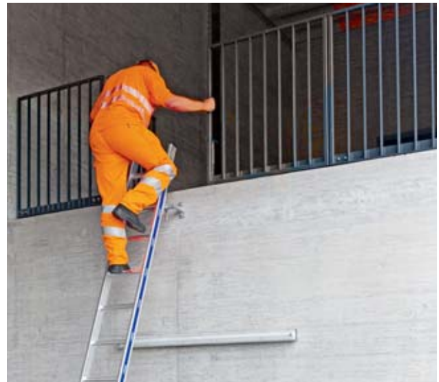
Bild 15: Haltevorrichtung, Geländer an Absturzkante und gesicherter Leiterkopf