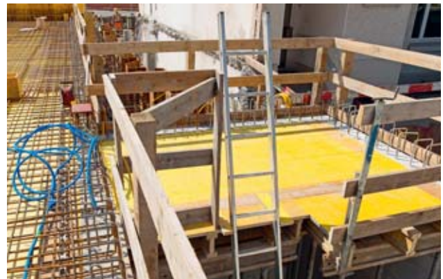
Bild 14: Die Leiter ragt mindestens 1 m über die Kante hinaus: ein sicherer Überstieg ist gewährleistet.