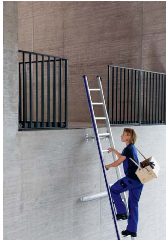
Bild 30 und 31: Blick und Körper zur Leiter gerichtet, Hände an den Sprossen und geeignete Tragmittel (angehängte Werkzeugtasche bzw. Umhängekiste)