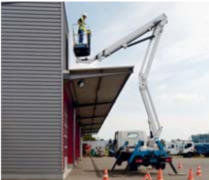
Bild 7: Ausleger-Hubarbeitsbühne