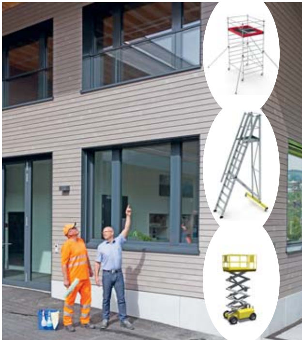
Bild 1: Besprechung des Arbeitseinsatzes: Welches Arbeitsmittel ist geeignet?

Prüfen Sie aufgrund des hohen Unfallrisikos jedes Mal, bevor Sie tragbare Leitern einsetzen, ob es nicht geeignetere und sicherere Arbeitsmittel gibt. Können die Arbeiten z. B. mit einem Rollgerüst, einer Hubarbeitsbühne oder Podestleiter ausgeführt werden?