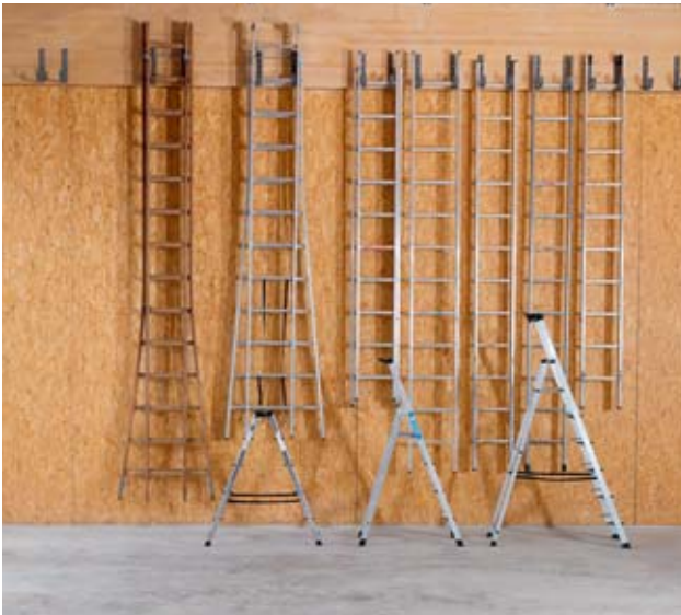
Bild 51: Saubere Lagerung – vor schädigenden Einwirkungen geschützt

Leitern müssen vor schädigenden Einwirkungen wie Feuchtigkeit, aggressiven Dämpfen usw. geschützt werden. Dies gilt besonders für Holzleitern. Sie sind in gut durchlüfteten Räumen vor Witterung geschützt zu lagern.