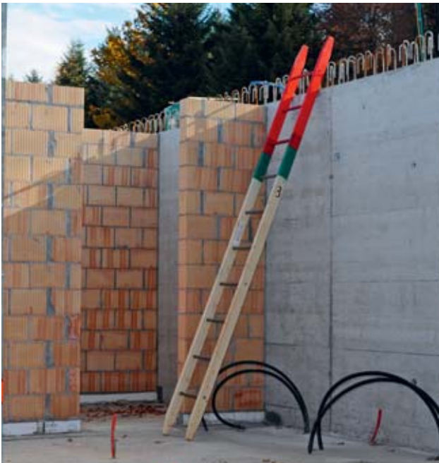
Bild 13: Anstelleiter: Die obersten drei Sprossen dürfen nicht betreten werden.

Die Länge der Leiter richtet sich nach dem vorgesehenen Einsatz. Wenn es keine gleichwertige Möglichkeit zum Festhalten gibt, dürfen die obersten 3 Sprossen nicht betreten werden. Beim Überstieg muss die Leiter die Ausstiegskante um mindestens 1 m überragen. (Bild 13 bis 16)