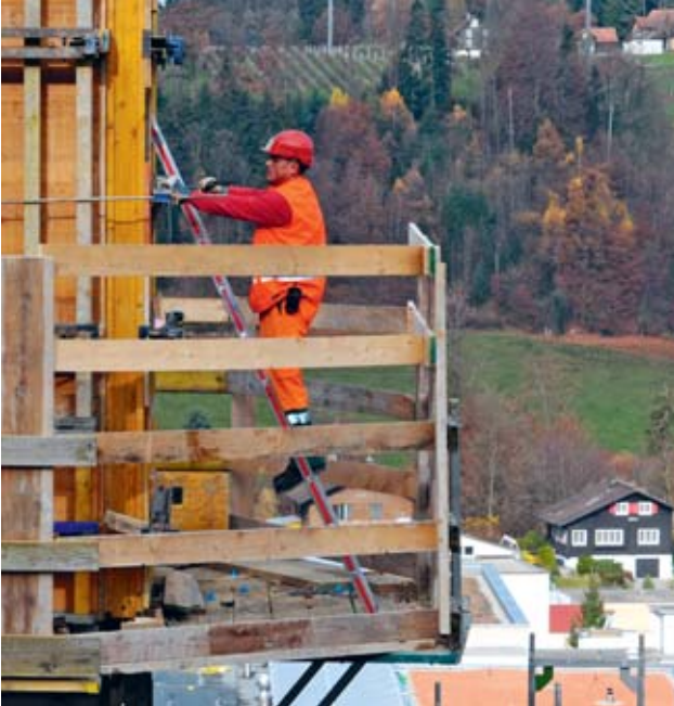
Bild 4: Zusätzliche Schutzmassnahme (hoher Seitenschutz) bei erhöhter Absturzstelle