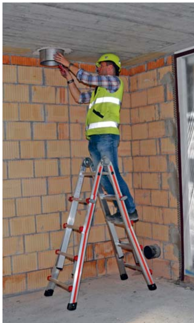
Bild 50: Kombileiter – als Anstellleiter, Bockleiter und Treppen-Bockleiter einsetzbar