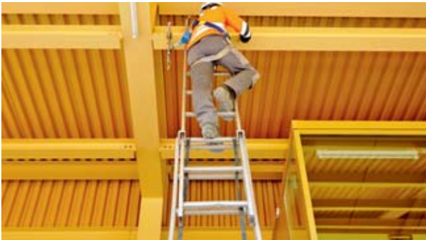
Bild 33: Person auf Leiter gesichert mit Anseilschutz. Anschlagstelle über Kopf