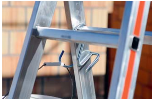
Bild 46: Eimerhaken