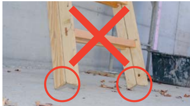
Bild 39: Bockleiter als Anstelleiter verwendet – Sie steht nur auf der Kante der Leiterfüsse.

Die Füsse der Bockleiter sind so beschaffen, dass die Holme bei richtiger Belastung (gespreizt aufgestellt) nicht rutschen. Bei einer zusammengeklappten und angestellten Bockleiter stehen die Leiterfüsse nur auf der Kante. Auf diese Weise rutscht die Leiter leicht weg und die Scharniere werden beschädigt.