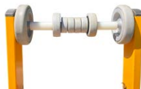
Mast- & Wandlaufrulle #3358100