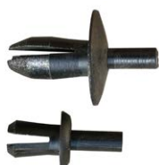
Schlagspreiznieten 6 x 10 mm: #42352035 7 x 17 mm: #42352036