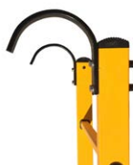
Einhängehaken 1 Stk. Ø 55 mm, #2500030 Ø 120 mm #2500040