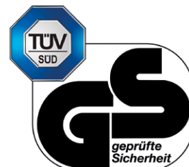
Zulassung: TÜV anerkannt und nach EN 131 getestet.