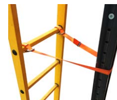
Zurrgurt mit Karabiner* #250055

*Universal Zubehör. Kann für alle Marken (Svelt, Tubesca, ...) gebraucht werden.