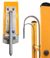
Grosse Auswahl an Zubehör