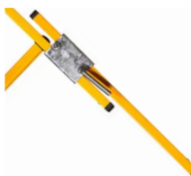
Holmverlängerung 0,9 m mit Stahlklemme Holm 58 mm #9200057 Holm 73 mm #9200073