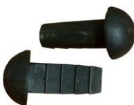
Gelenkbolzen Paar #42352005