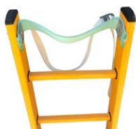
Mastgurt inkl. Sicherheitsseil #92335801