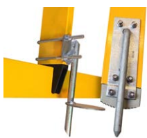
Flexible Eisspitzen #91700111 #91700112 (für Traverse)