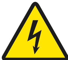
Geprüft 1000 Vac/1500 Vdc