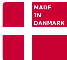
Produziert in Dänemark, 10 Jahre Garantie