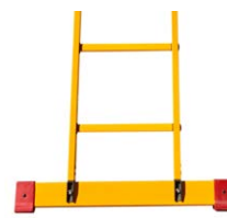
Traverse fix oder mobil