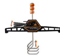
Auto Leiter-Befestigung* #250013