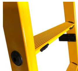
52 mm Antirutsch-Sprossen