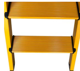
88 mm Antirutsch-Stufen