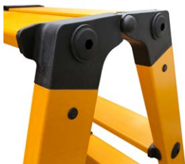
100% ohne Metall