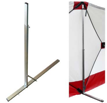
Stative zum stabilisieren der Sichtschutzwand sind im 3er-Set erhältlich.