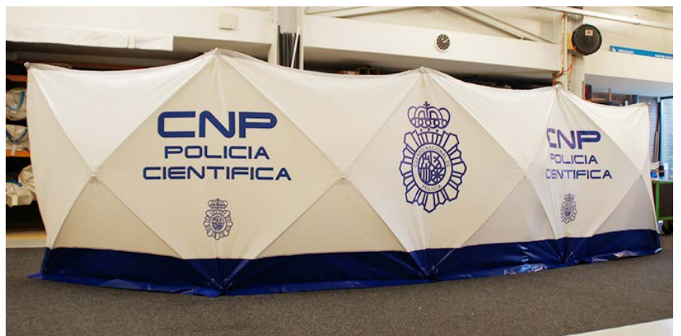
Die Sichtschutzwand kann auf Anfrage auch individuell bedruckt werden.